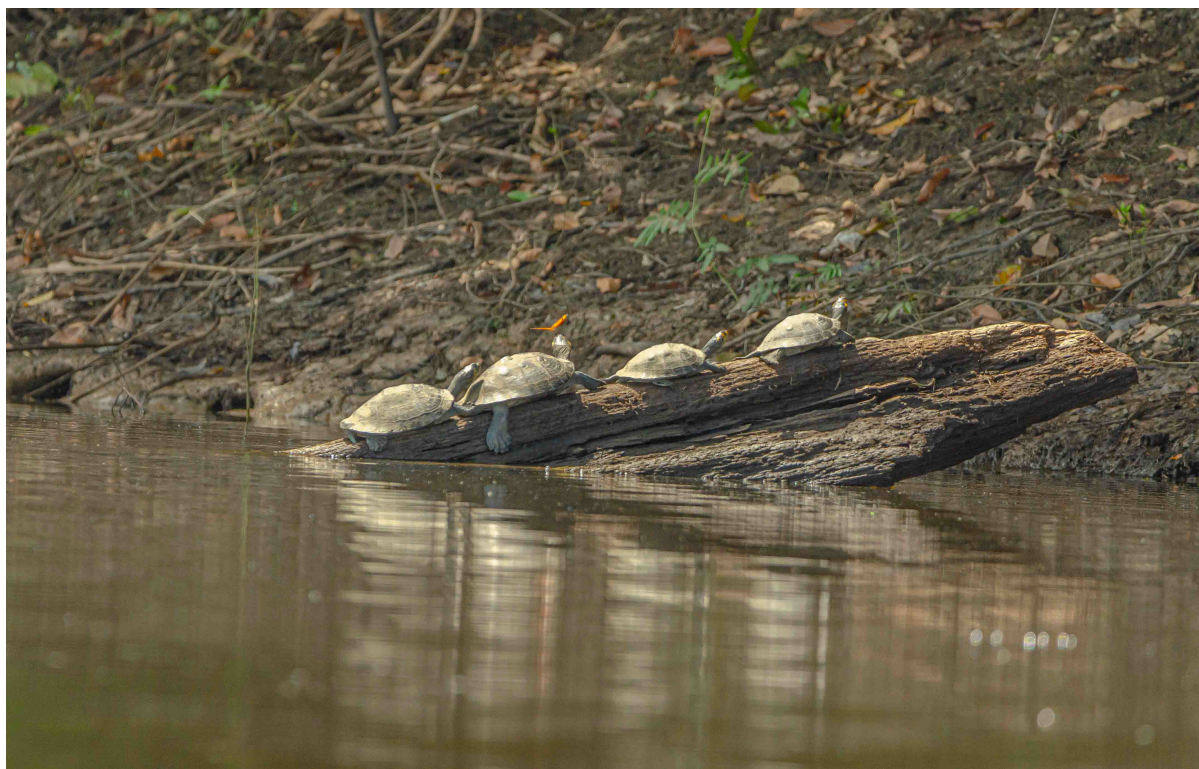
Figura 4. ( Podocnemis sp.) Lago Tarapoto, 2023