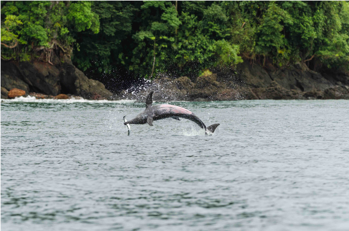
Figura 5. ( Steno bredanensis ) Delfín dientes rugosos. Bahía solano, 2022