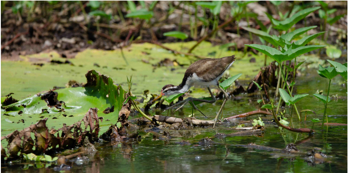
Figura 2. Jacana spinosa . Centroamérica, 2023