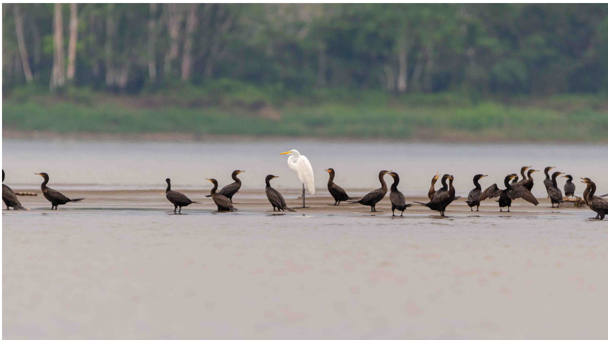
Figura 1. Ardea alba (Garza Blanca). Puerto Nariño, 2023

La sequía es un fenómeno natural meteorológico complejo, transitorio y de lento desarrollo, que se origina por la ausencia de lluvias en periodos más o menos largos, en conjunción con altas temperaturas y altas tasas de evaporación en territorios específicos. Este fenómeno causa desequilibrio hidrológico grave, con disminución drástica de caudales en las fuentes de agua y en la oferta hídrica disponible; afectaciones en el sistema vegetación-suelo, con la deshidratación en las zonas de raíces, donde se detiene el suministro de agua a las plantas; y alteraciones en las relaciones y reacciones fisicoquímicas de los seres vivos, sus ciclos biológicos y sus